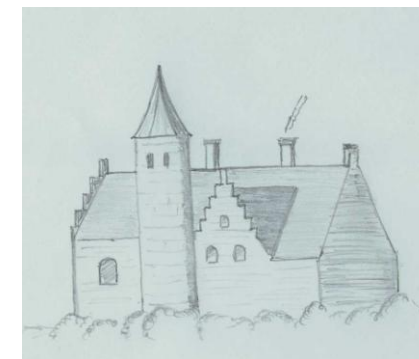
Kasteel Cronesteyn rond 1600

In 1975 kwam Cronesteyn in handen van de gemeente Leiden. In 1982 werd het polderpark gerealiseerd naar het ontwerp van Evert Cornet. Het park is geworden tot ontmoetingsplek, rustpunt, historisch monument en speciaal biotoop.